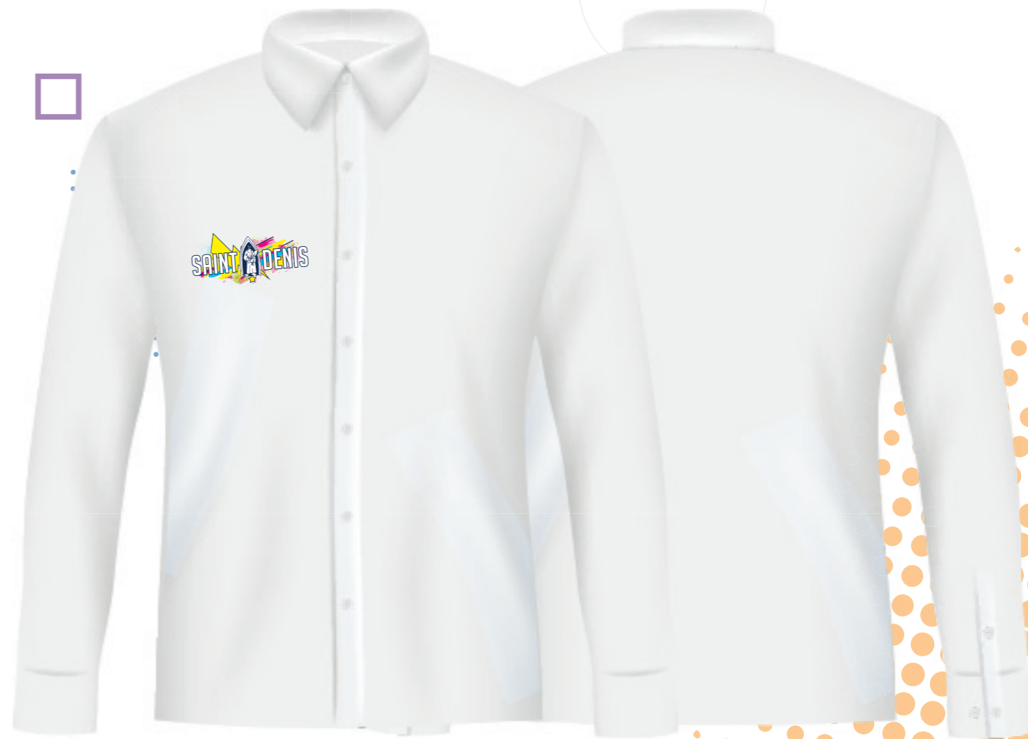
COULEUR NON DÉTERMINÉE - MODÈLE DE PRÉSENTATION