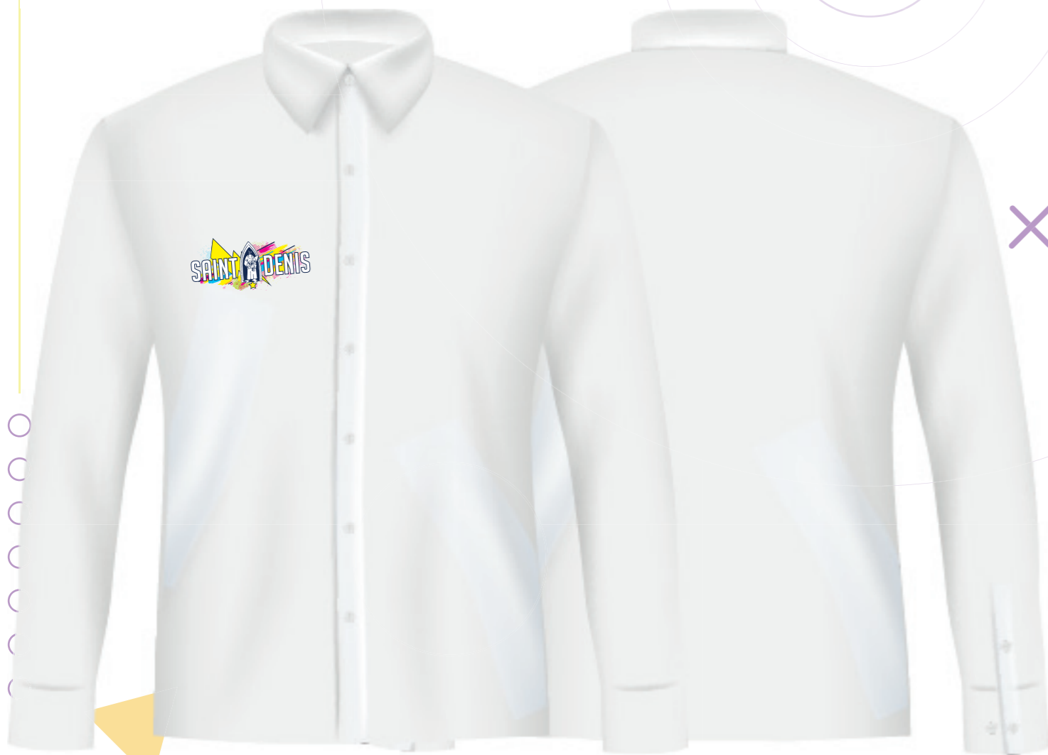
COULEUR NON DÉTERMINÉE - MODÈLE DE PRÉSENTATION