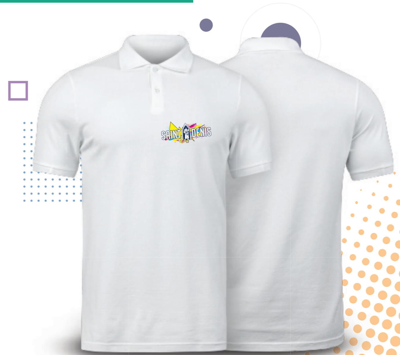
COULEUR NON DÉTERMINÉE - MODÈLE DE PRÉSENTATION