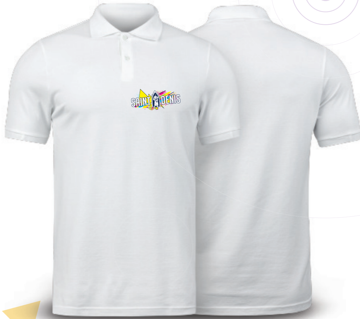
COULEUR NON DÉTERMINÉE - MODÈLE DE PRÉSENTATION